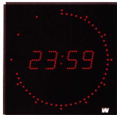
Typ 7 - segment Utan hörnprofil 119470-51