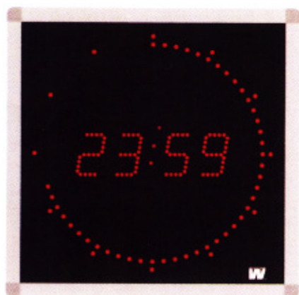
Typ 7 - segment 119474-51