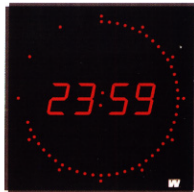
Typ 7-segment Rundade hörn av polerad aluminium 119472-51